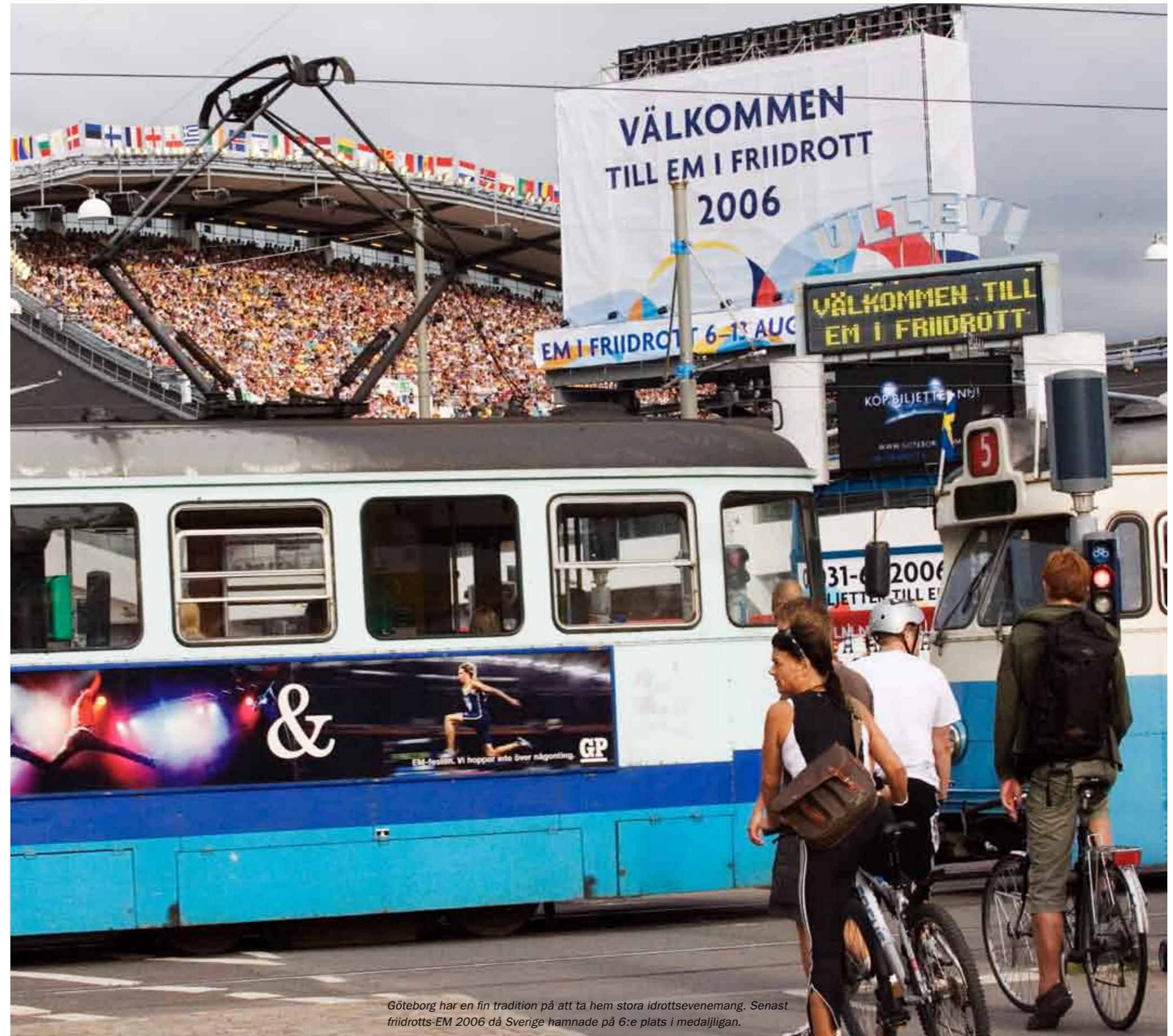
Göteborg har en fin tradition på att ta hem stora idrottsevenemang. Senast friidrotts-EM 2006 då Sverige hamnade på 6:e plats i medaljligan.

På papperet, mer konkret i regeringsför-