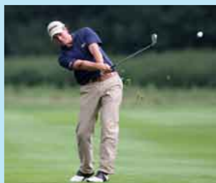
Taekwondo-EM i Skövde och lag-EM i golf i Österåker är ett par av de större evenemang som hålls i Sverige under året.

är ju svensk så han är noga med att betona att det snarare var ett team som gjorde det.